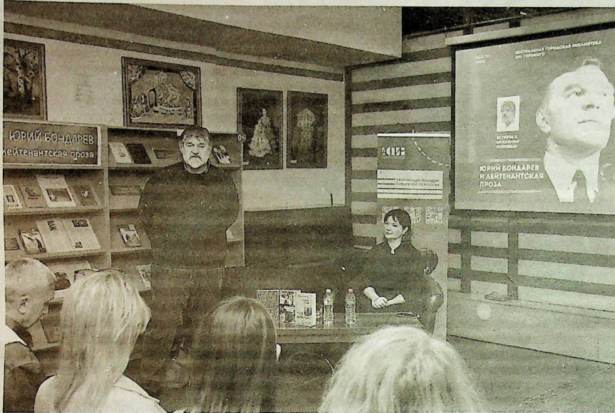
Михаил Попов в Орске провел встречи в колледже искусств и в ОГТИ, в Центральной библиотеке и модельной библиотеке «Пять горожан»

Познакомил Михаил Михайлович орчан и с собственным творчеством. Библиотеки Орска получили три его книги: «На кресах восточных» (2015 г.), «Подмосковные вечера» (2019 г.) и «Трое неизвестных» (2023 г.).